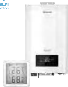
Электрические котлы и комнатные термостаты