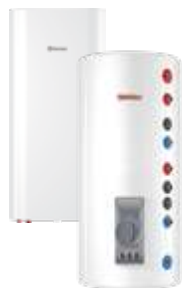
Комбинированные (косвенные) водонагреватели